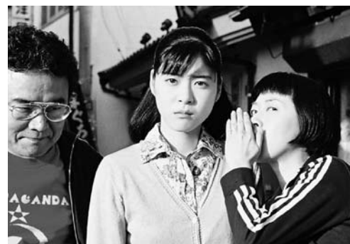
亀は意外と速く泳ぐ

三木 聡 (Satoshi Miki) 1961 年生まれ。映画監督。慶応義塾大学卒業。「ダウンタウンのごっつええ感じ」、「タモリ倶楽部」、「トリビアの泉」、「TV's HIGH」他、多くの TV バラエティ番組の構成を手掛ける。テレビドラマ「時効警察」シリーズ、「週刊真木よう子」の演出・監督、映画では「イン・ザ・プール」(05)、『亀は意外と速く泳ぐ』(05)、『タメジン』(06)、『凶鑑に載ってない虫』(07)、『転々』(07) を発表。まもなく新作『インスタント沼』の公開が予定されている。