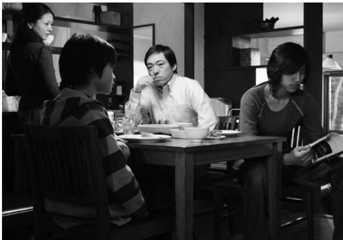
トウキョウソナタ