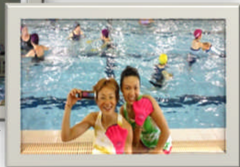
K&E 上社様・BLUE SEMINAR