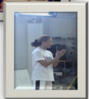
K&E あいち様・健康セミナー