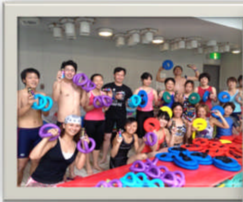
株式会社 三立様 ・SANRITSU 特別ワークショップ