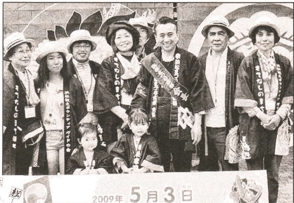
浜松市長との記念写真