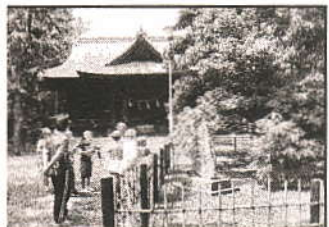
東小史跡ウォーク