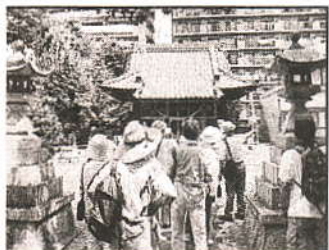
県民の日鹿嶋神社