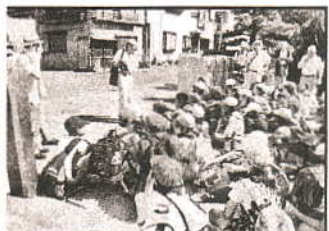
船越小ふるさと講座