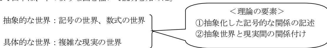
図1 抽象の変化として理論の位置づけ

幸恵は、田中の理論と言うのがよく解らなかったが、とりあえず大人しく聞いてみることにした。そこで田中は、下のような図を描いて説明を始めた。