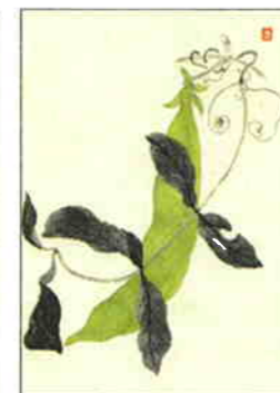
38 豌豆 [春]