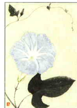
37 朝顔 [夏]