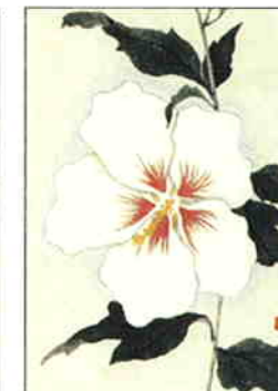
30 木槿(宗旦) [夏]