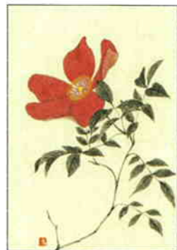
32 はまなす [夏]