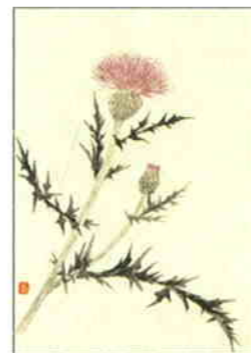
36 のあざみ [夏]