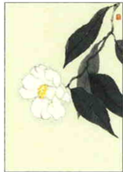
24 柳葉侘助 [冬]