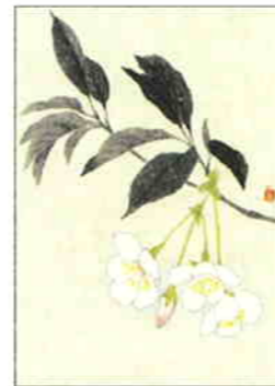
26 大島櫻 [春]