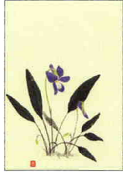
4 堇 [春]