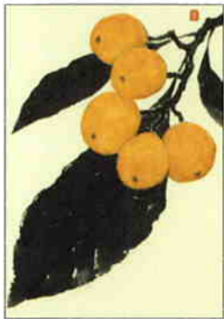
21 枇杷 [初夏]