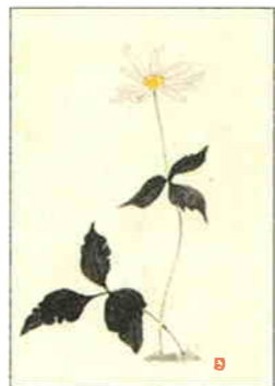
34 雪割一華 [早春]