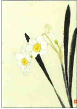
1 水仙 [冬]