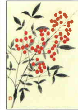
9 南天 [冬]