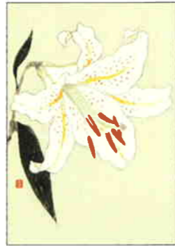
13 山百合 [夏]