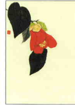
8 戴椿 [冬]