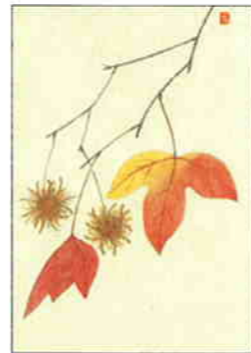
25 楓の実 [秋]