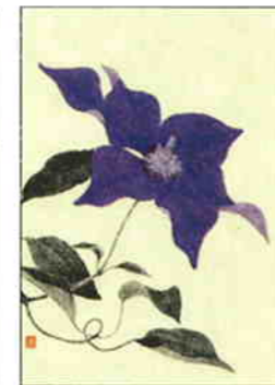
28 鉄線 [夏]