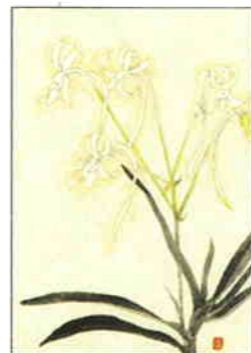
35 風蘭 [夏]