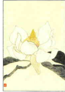
5 受咲大山蓮華 [春]