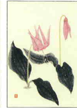
10 かたくり [早春]