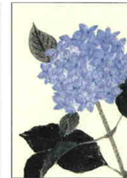
20 紫陽花 [初夏]