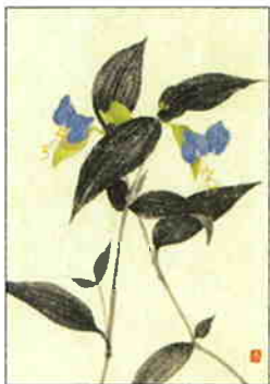
31 露草 [夏]