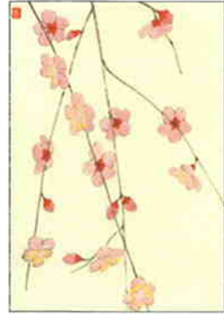
2 枝垂梅 [春]