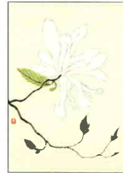
17 しでこぶし [春]