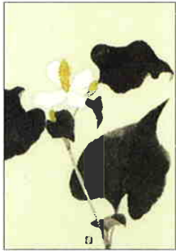
11 どくだみ [夏]