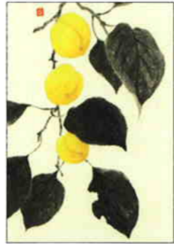
14 杏の実 [初夏]