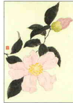
16 山茶花 [秋]