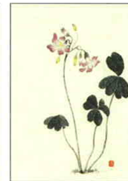
29 紫かたばみ [初夏]