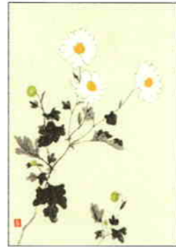
15 野路菊 [秋]