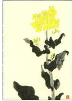
3 菜の花 [春]