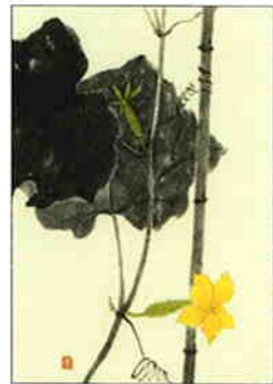
22 胡瓜 [夏]