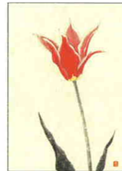
27 チューリップ [春]