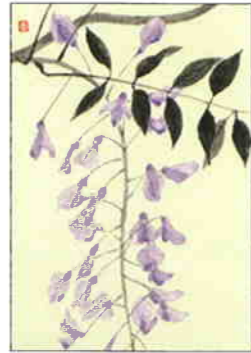
12 藤 [春]