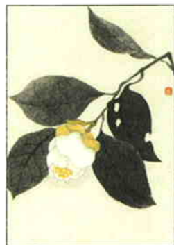
33 椿(加茂本阿弥) [早春]