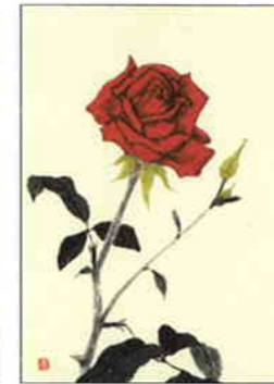
18 薔薇 [春]