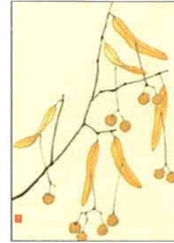
7 菩提樹の実 [冬]