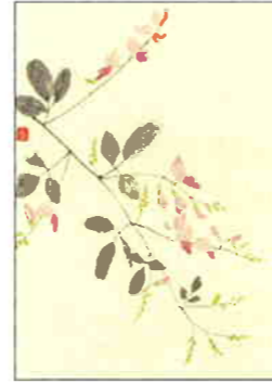
6 萩 [秋]