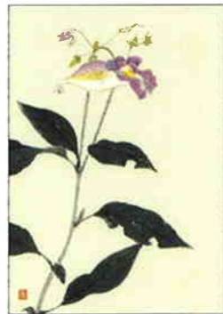
23 釣船草 [秋]