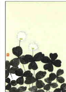
19 クローバー [春]