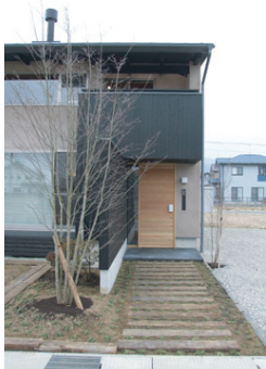
NPO法人長野県地域支援センター「信州木造り工房」プロジェクト #004