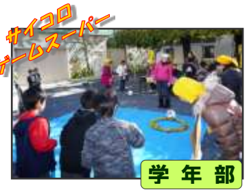
サイコロ ゲームスーパー