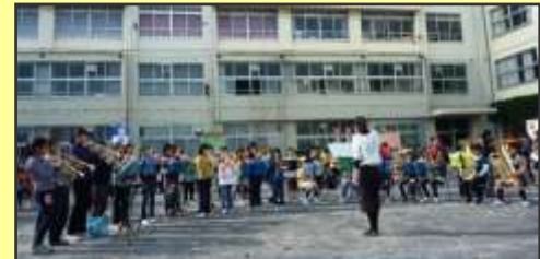
合奏教室による迫力あふれる演奏