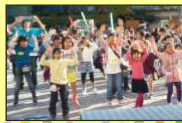
フィナーレは盛り上がりダンスでした