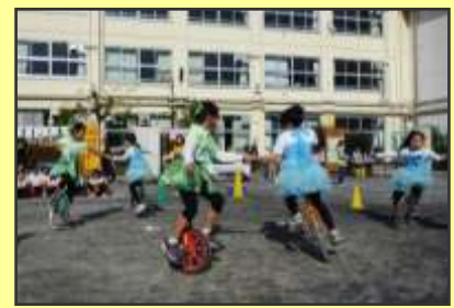
ハラハラドキドキしました！すごいねクローバー