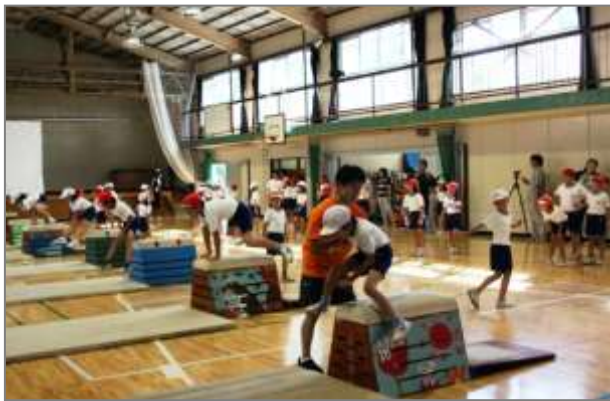
開脚飛びがどんどん上達していきました