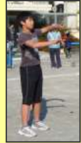
中野区立第三中学校の生徒さんによるハイパーヨーヨー たくさんのパフォーマンスに皆ぎげでした