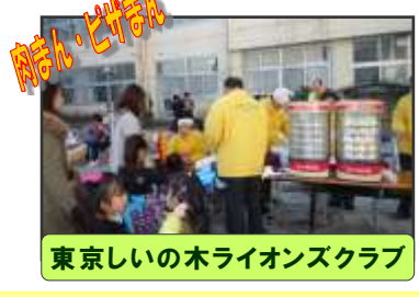
肉まん・たまごまん