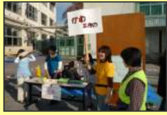
子ども実行委員会の革工作