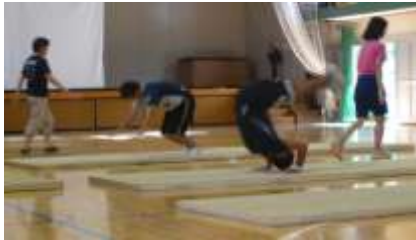
塔山小学校の先生方にもご指導いただきました