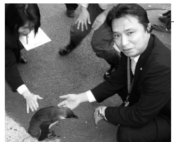
動物園ではペンギン 赤ちゃんに遭遇

◆視察・研修・訪問先…東京湾全域、臨海副都心、立川防災センター、立川防災基地、都立小金井養護学校、都立生活実習センター、都立小金井市公園、江戸東京たてもの園、特別養護老人ホーム(小金井市)、仙川上流部、都議会議事堂屋上緑化、都立小金井工業高校、警視庁、神田川・環状7号線地下調節池、荒川ロックゲート、隅田川、旧中川、荒川、葛西臨海公園、障害者福祉施設(青梅市)、新環状8号線工事現場、東京都森林組合、林道工事現場、奥多摩湖周辺、檜原村中学校、奥多摩間伐現場、シカ繁殖被害地、多摩川万年橋、玉川上水、小金井桜、池袋駅東口タクシール、築地卸売市場。