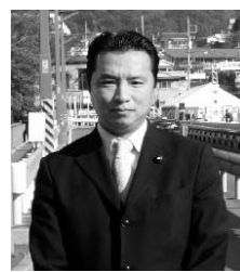
選挙が連続し、まさに選挙イヤー(平成十七)

年が終わり、心機一転いよいよ新年を迎えることとなりました。初当選から約半年が経過いたしました。1期生ながらも会派等での要職を拝命し、その重責を果たしていく決意で新年を迎えさせていただきました。予算規模12兆5千億円という国家規模の予算を執行する首都東京をチェックする都議会議員として、その職責と使命を果たすべく、言わば「インク取紙」のように様々な事を吸収しながら、東奔西走の毎日を歩み続けて参りました。