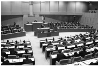
▲12月1日都議会本会議・知事所信表明

平成17年第4回定例会が12月15日に終了しました。今議会は姉歯建築設計事務所による耐震データ偽装問題が大きな関