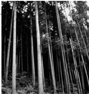
急がれる花粉症対策！

都は11月、「スギ花粉の量を10年間で2割削減」との目標を決定しました。その対策