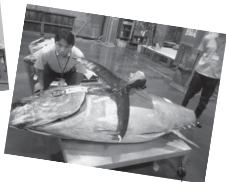
8月4日(水)都議会民主党築地対策PTにて札幌市場の現地再整備を視察