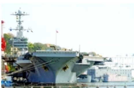
メンテナンス中の原子力空母

1次冷却システムは、原子炉と直結しており、このメンテナンス作業は放射能管理を伴う危険な作業だといわれています。