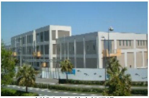
新設された終末処理場

やってきましたが、西浄化センターができたこと により、市内の下水道普及率が 90 % を超え、新 たな設備投資から施設管理の時代へと変わりつつ あります。そのような中、新たな設備投資を慎重 に行わなければ、そのつけが料金に跳ね返ります。 2004 年度から始めている合流改善事業(雨水と汚 水を分ける取り組み)では処理施設建設に 45 億円。 バイパス管の工事などを合わせると当初計画では 約 400 億円の事業です。現在見直し作業をしてお り、総事業費の縮小の可能性もあるようですが、 いずれにしても多額な設備投資となります。この 事業は、東京湾の水質改善を目的としたもので、 国が主導する環境対策事業です。市民サービスの 向上ではなく環境対策であれば、国や市がその費 用は持つべきであり、その費用を料金に転嫁し、 値上げをする方向になっては問題があると指摘し 国が責任を果たすよう強く求めべきと述べました。