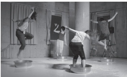
09年 「nowhere —ばら色の日々」

モダンダンス、バレエ、ボディワークを学ぶ。2011年青山学院大学 WSD 育成プログラム修了ワークショップデザイナー。黒沢美香 & ダンサーズのメンバーとして活動した後、1989年川口隆夫と ATA DANCE を結成。共同で作品製作を行う。96年よりソロ活動開始。07年の京都ダンスプロダクションをきっかけにグループ作品を創り始める。09年夏、門仲天井ホールにて「nowhere—ばら色の日々」を上演。作品毎にユニットを組む、Unit Dance Bookshelf を今回より名乗る。動きの必然にこだわりの「書物を読むようにダンスの行間を読み解く」を信条に活動中。