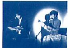
おしゃべり本棚朗読会