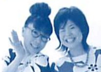
「ザ・ピンチーズ」 5/3・5/5