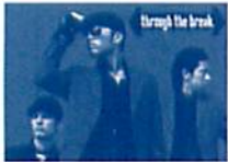
「through the break」 5/9・5/10