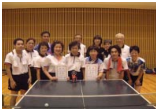
平成16年度静岡市社会人リーグ(中期)を戦い終えた後の記念撮影