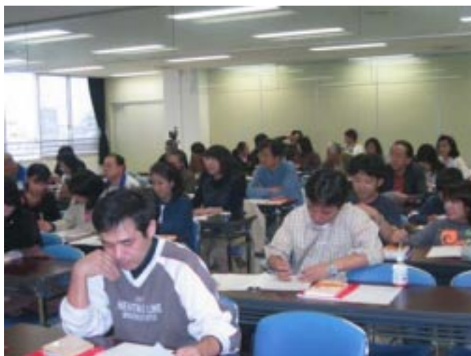
「対応型ボールゲームのためのステップアップ講座～発想を変えてみませんか？～」の様子

10月31日に、「対応型ボールゲームのためのステップアップ講座～発想を変えてみませんか？～」を、静岡市のパルシェ貸会議室にて開催した。講師は、本会代表で、静岡大学助教授、日本卓球協会スポーツ医科学委員会委員、日本オリンピック委員会強化スタッフも務める吉田和人。卓球などの対応型ボールゲームにおける発想転換の方法について、科学的な視点に基づき、卓球の事例を紹介しながらやさしく解説した。千葉県、愛知県など、県外からも多数の方が参加した。この講座の様子は、卓球専門誌「卓球王国」でも紹介された。