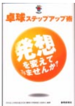
「卓球ステップアップ術 発想を変えてみませんか？」の表紙

本会発行の週刊無料メールマガジン「卓球メールジャーナル」が元になり、「卓球ステップアップ術 発想を変えてみませんか？」(吉田和人編著、静岡新聞社発行、1,470円)が、3月31日に出版された。本書の出版については、「卓球レポート」「卓球王国」「静岡新聞」など、多くのメディアで取り上げられた。