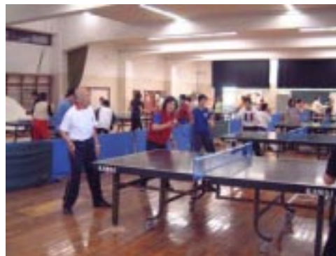
「大人のための初心者ラージボール卓球交流会」の様子

昨年度、本会では、toto(日本スポーツ振興センター)とヤマト卓球株式会社の支援を受け、静岡市内の3ヶ所の会場で「大人のための初心者ラージボール卓球教室」(参加費無料)を開催した。そして、2004年3月28日には、同事業の各会場の参加者とヒッティングパートナーなどが一同に会して交流を深めることと、参加者のさらなる上達を目的に、静岡大学体育館にて「大人のための初心者ラージボール卓球交流会」を開催した。