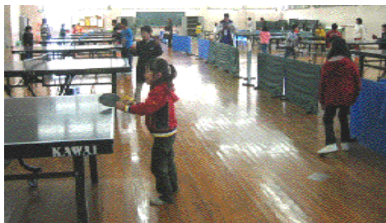
スポーツ体験フェスティバルの「ジュニア卓球教室」

静岡大学の以下の3つのスポーツ関連事業に、「後援」、または「協力」として、運営のサポートにあたった。