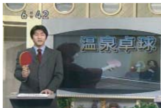
第4回温泉卓球交流会 in 箱根を放送したNHKの「たっぷり静岡」のひとコマ

なお、第4回温泉卓球交流会については、NHKから同行取材を受けた。そして3月28日に「たっぷり静岡」の中で10分間程、このイベントの様子が紹介され、視聴者から大きな反響があった。