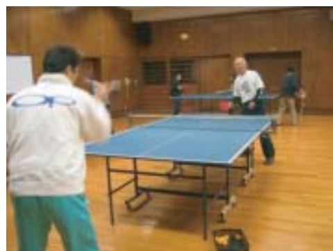
ヒッティングパートナー（奥）のサポートを受けて、ラリーを続ける参加者（手前）

このイベントには、地域の指導者や選手がヒッティングパートナーとして、参加者の連続ラリーをサポートした。イベント終了後、参加者から「思ったよりラリーが続いておもしろかった」「今後は、継続的に卓球を楽しみたい」という声が多く聞かれた。