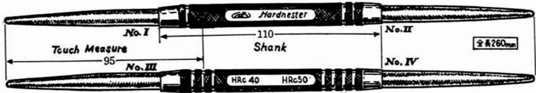
(但細密用：HV表示は上記寸法× \frac{1}{2} )